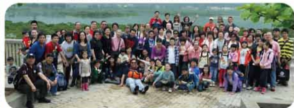
弟兄姊妹在大澳合照