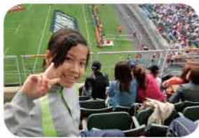
學生們能感受到球場上熾熱的氣氛