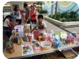
單位義工積極參與義賣工作