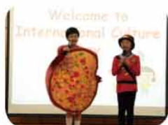
學生介紹國際文化日