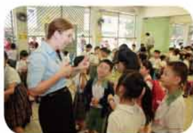
同學們跟MEHL短宣隊的同工相處甚好