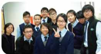
節奏樂器班同學合照