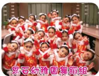
本校舞蹈組同學合照