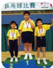
本校同學包辦冠、亞、季軍