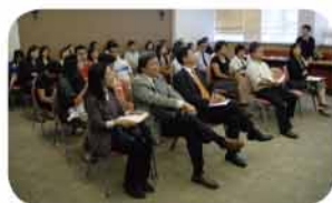
本會各小學校長及老師正參與本校舉辦之數學科交流活動