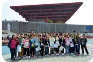
在上海世博園區合照