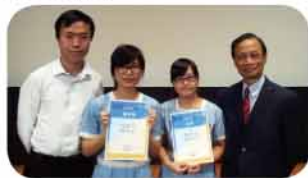
「疫苗與你」獲獎相片